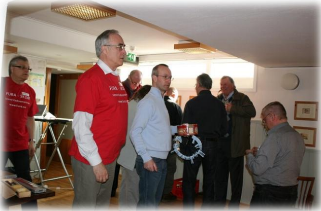
Vid incheckningen DCU EKA o RIX med lottringen