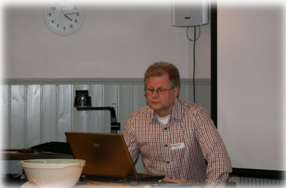
Tomas XVV visade 2 antennanalyser