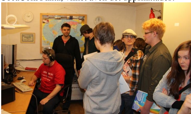
Per SM2LIY visar FURAs station för Hannaskolan-elever!

Klubben bjöd dagen till ära på kanelbullar och CocaCola/Fanta, vilket även det uppskattades!