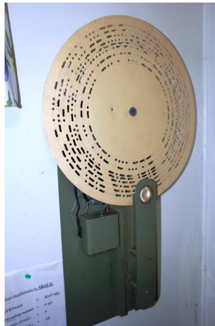
Detta är en CQ-maskin tillverkad av SM6PU (sk). Det fanns några skivor till i klubbens ägo.

Tack till Borås Radioamatörer! Passade samtidigt på att hälsa dem välkomna till Umeå till våren. Skulle vara kul sa Roland EAT, vi får väl se!