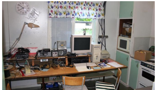
Kombinerat stationsrum och kök.