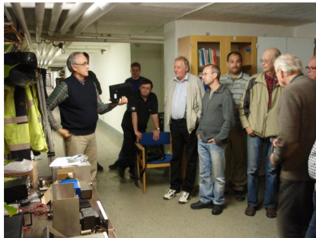
EKA - "Får jag ett bud? Auktion 13/9 2012.

Det är lite nytt att vi inom FURA har medlemsmöte. Vi tänker försöka att ha det kanske 1 gång per termin. Det är ett sätt att vi i styrelsen får lite synpunkter på hur föreningen drivs och kan drivas framöver.