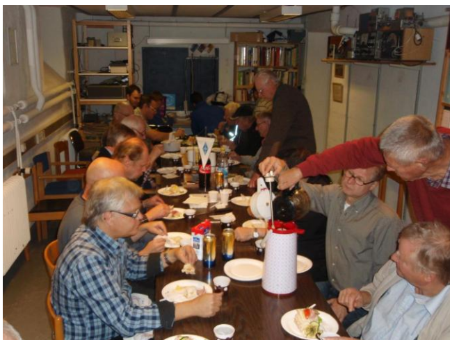
Medlemsmöte med "Gofika"