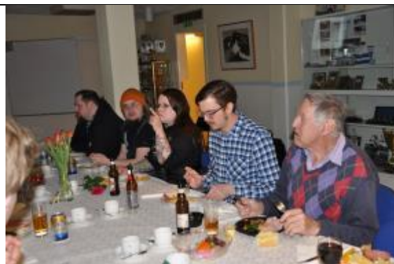
Ungt och lite äldre (!) vid matbordet