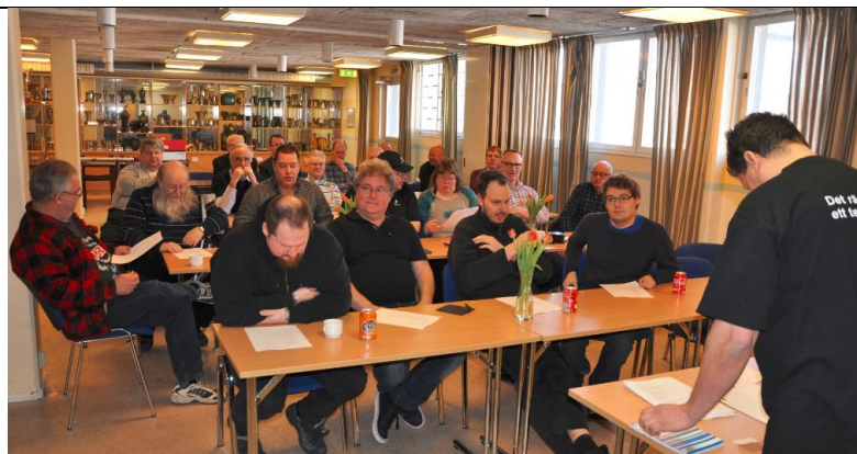
DS2mötet i UMEÅ