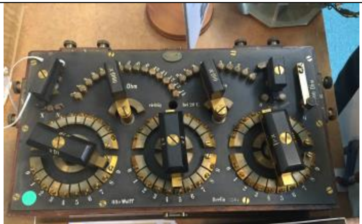
"Imponator" från förr. Var ej till salu!