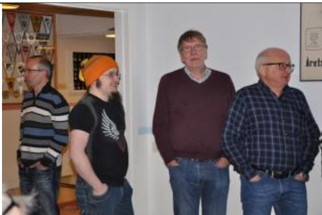
...måste ha varit kyligt i lokalen eller så hade man smutsiga naglar?