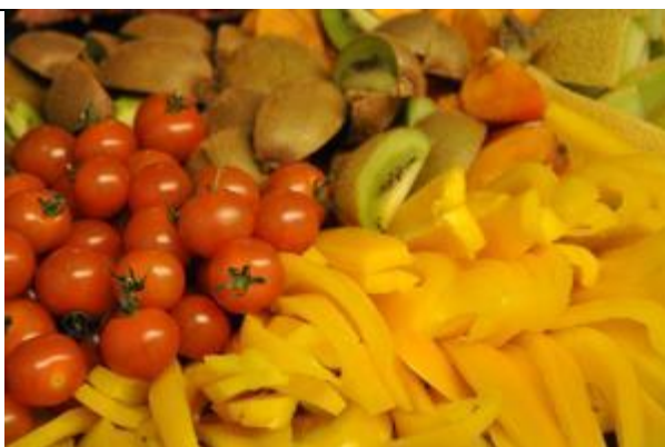
...och mat fanns det massor av