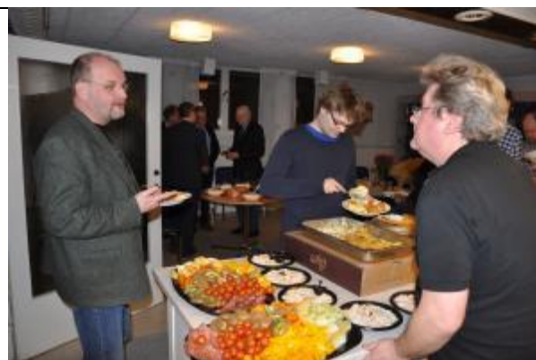
...så Tilman tog gärna mer!