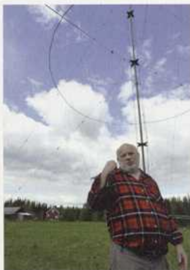
Die Multiband-Antenne deckt den Bereich von 3 bis 30 MHz mit exzellenten Resultaten ab.