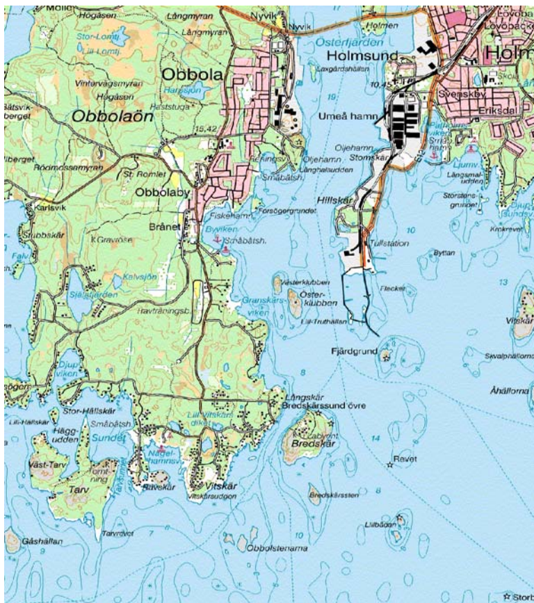
Ovan: Så här körde Multi-op stationerna från IOTA år 2004. Ett urklipp med bättre skärpa än kartan nedan kan kanske pryda ett framtida SK2T QSL-kort.