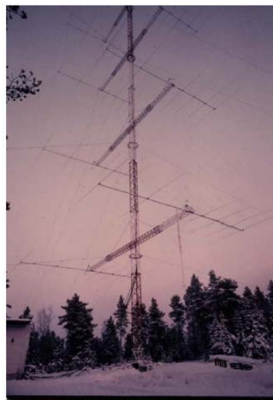
En 8 gånger 6 elementare för 20 m från 70-talet hos OH8OS.

Skicka material för nästa FURAbld så snart som möjligt till Kurt SM2YIZ@SSA.SE inför den kommande hösten.