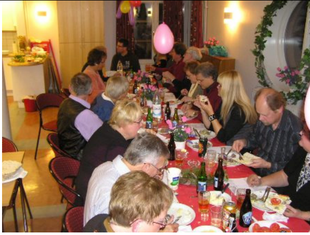
Gourmet-gänget i full aktion!