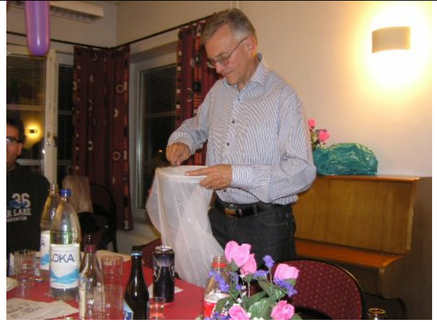
Wille AVG städar upp