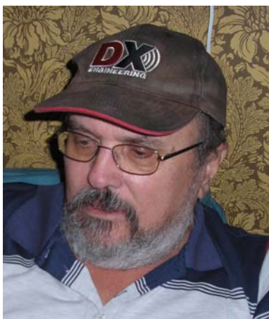
Rainer DMU framifrån innan CQ WW SSB 06, för baksida se förra numret av FURAbadet.

Två av FURAs medlemsstationer var aktiva under CQ WW SSB delen. 7S2E deltog i Multi-Single klassen med DMU, LIY och YIZ som OPs, medan SJ2W deltog i Single-OP All Band med 2-radio-Micke 3WMV bakom lurarna.