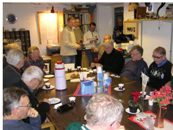
"Vann jag nu då..." Lotteridragning