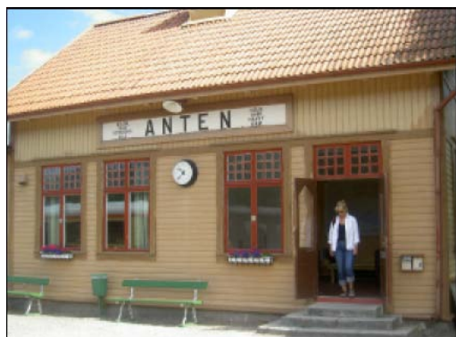
ANTEN -RADIOINSPIRERAT NAMN PÅ JÄRNVÄGSSTATIONEN

Ett museum som jag varmt kan rekommendera för 'mogna pojkar'. XYL väntade tålmodigt när jag skulle titta på alla gamla lok, rälsbussar, vagnar och övrig järnvägsnostalgi. Det fanns även möjlighet att åka den 12 km långa sträckan med Hägglunds kända rälsbussar eller persontåg som dras av ett pustande ånglok.