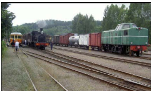
MYCKET TÅGNOSTALGI PÅ STATIONSOMRÅDET I ANTEN

Som amatör spanar man ofta efter master och antenner efter vägen. Det är klart att man blir lite avundsjuk när man ser de amatörer som bor högt på någon stor slätt med i princip fri sikt runt horisonten. Speciellt tydligt var det på Jylland i Danmark. Där upptäckte jag många hus med antenner och parabolerna för våra högsta frekvenser. Det är klart att det går bra att köra VHF och mikrovåg med de geografiska förutsättningarna.