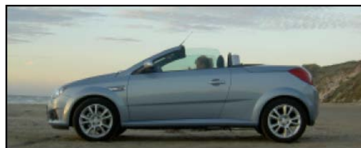
OPEL TIGRA PÅ MILSLÅNGA SANDSTRÄNDER I SKAGEN