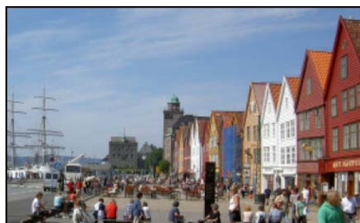
BERGEN BRYGGE – ETT AV UNESCOS VÄRLDSARV

Från Danmark går färden vidare mot Norge med Bergen som delmål. En av de få städer i Norge som vi missat i våra tidigare Norgeturer. Staden är mest känd för Bergen Brygge, de gamla sjömagasinen byggda på träpålar i vattnet. Bryggen är ett av UNESCOs många världsarv. En annat måste i Bergen är en tur med Flöibanan, den går upp till fjället med fin utsikt över hela staden. Personligen upplevde jag Bergen som lite överreklamerad jämfört med de många andra vackra platser som kan besökas i Norge.