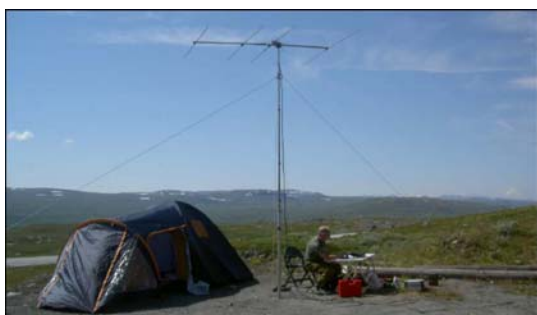
LA3DV – PORTABEL QTH PÅ HARDANGERVIDDA. 6 METERS ANTENN MED MILSVID UTSIKT EN UNDERBAR SOMMARDAG.