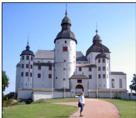
LÄCKÖ – HISTORISKT SLOTT MED SKATTKAMMARLYX

Semesterturen gick vidare genom Sverige med stopp på många intressanta platser. Några av de historiska som besöktes var den gamla Koboltgruvan i Loos samt Läckö slott strategiskt belägen vid Vänerns södra spets.