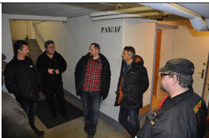
Prat i korridoren! UVU LIY SJ2W m fl