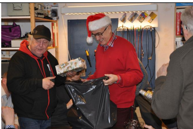
FBQ ser lycklig ut när han får en julklapp av tomten EKA