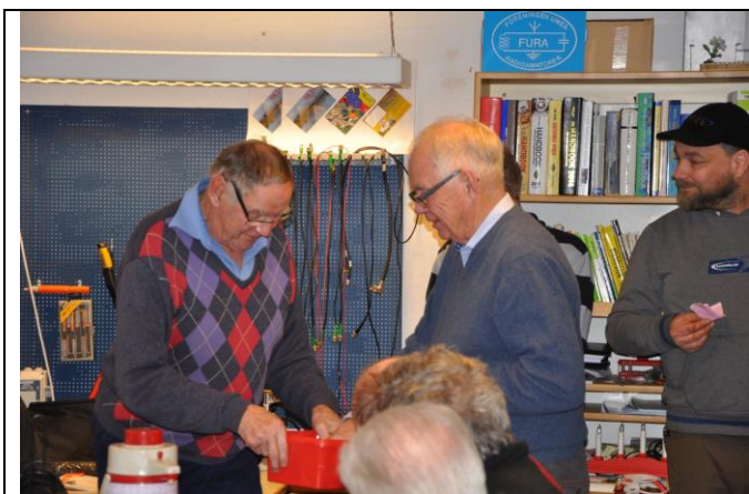
CKR också lotterivinnare