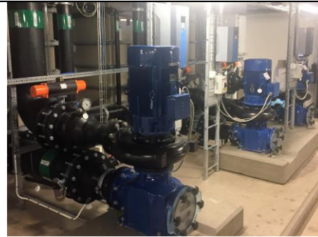
Pumpar i massor