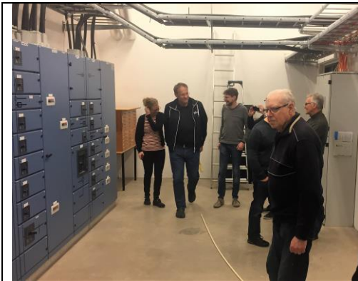
Elcentralen där man inte fick fota....