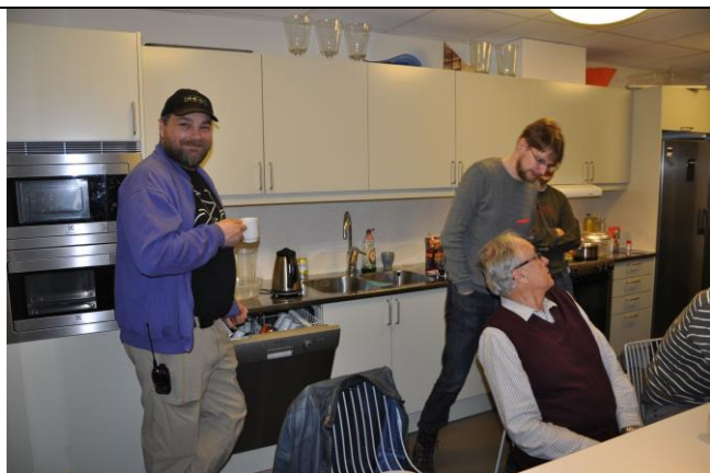
VJX och kvällens kaffevärd AVR