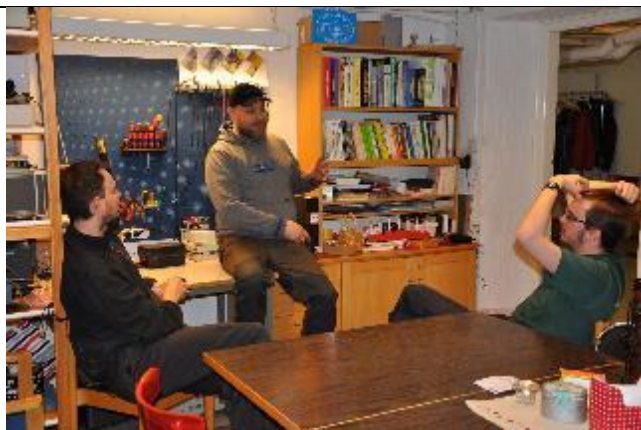
Eftersnack i samlingslokalen BRJ VJX TMS