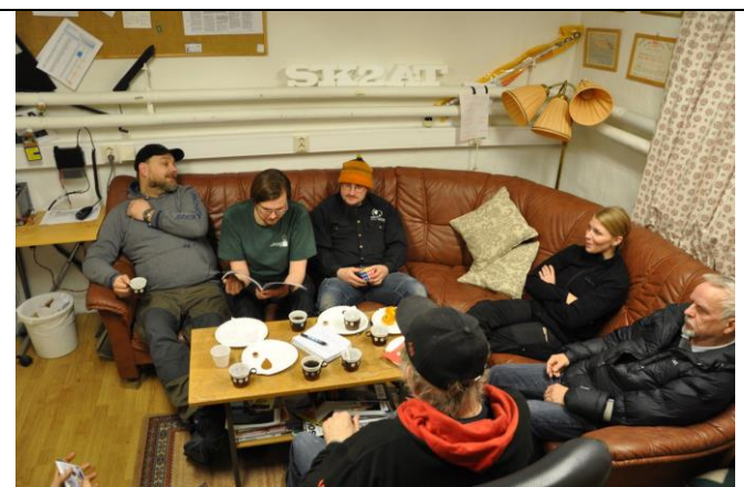
Snack i fikaavdelningen VJX TMS KNG RMJ MZC m fl