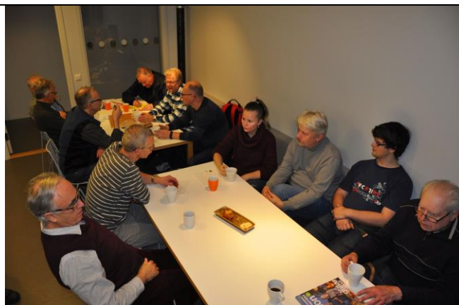
Samvaron vid fiket