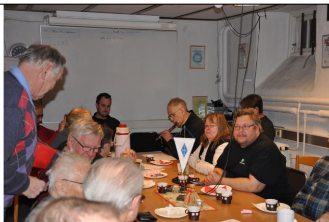
Sten SXT säljer lotter vid fikabordet!