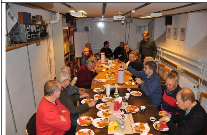
Fler bild från det välfyllda fikabordet