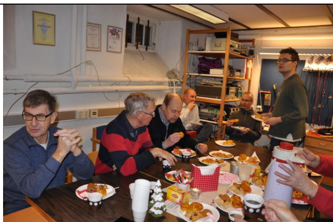
Fikabordet SUM BJS DJK AVU RIX BLV