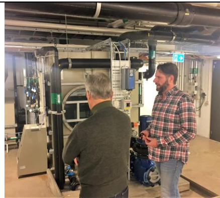
Per MTR beskriver funktion för Wille AVG.