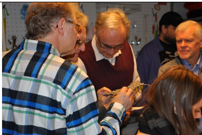
Kopplade LED i tyg