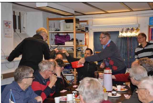
En av lotterivinnarna WTY