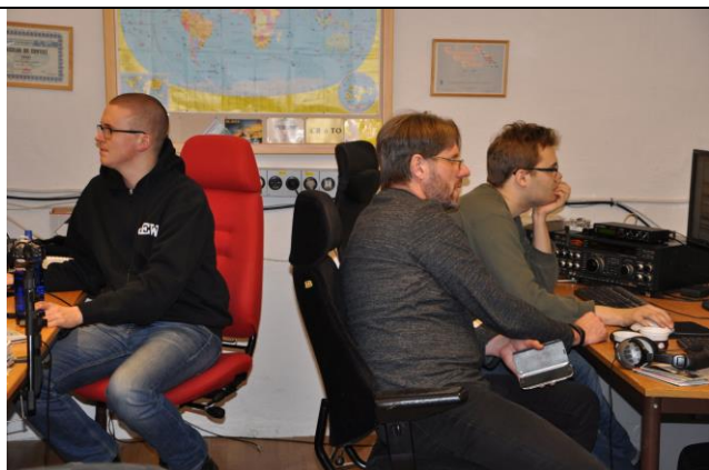
Aktivitet i schaket PKA MTR BLV

Som vanligt var det på slutet julklappsutdelning, säkert \frac{3}{4} av deltagarna hade tagit med och fick förhoppningsvis nya fina klappar åter.